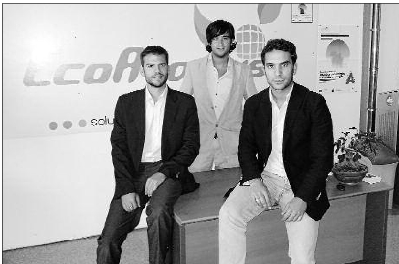
Emprendedores. Los tres socios de la empresa EcoAvantis.

Por último, la distribución de productos ecoeficientes ha ido evolucionando hasta especializarse en la importación y distri-